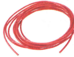
Провід силіконовий QJ 20 AWG