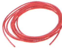
Провід силіконовий QJ 13 AWG