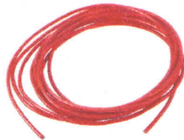
Провід силіконовий QJ 10 AWG