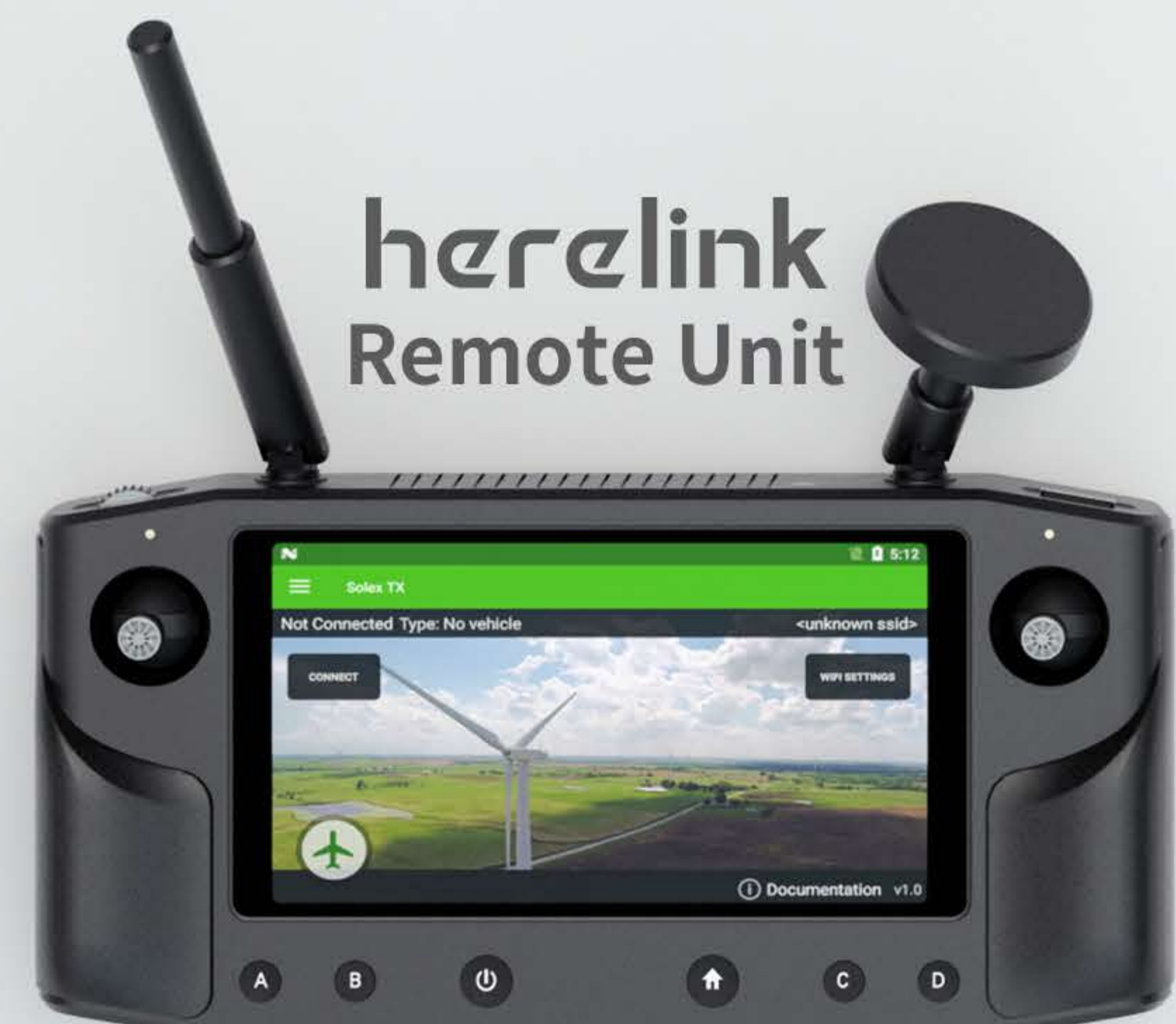
herelink Remote Unit

Удосконалена система керування батареєю, що підвищує ефективність роботи