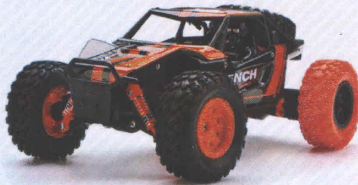
Іграшка радіокерована Автомобіль з двигуном: арт. НВ-SM2402