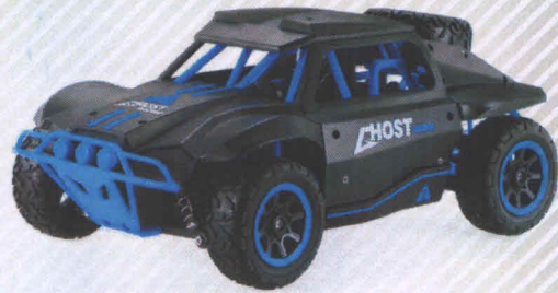
Іграшка радіокерована Автомобіль з двигуном: арт. НВ-DK1802